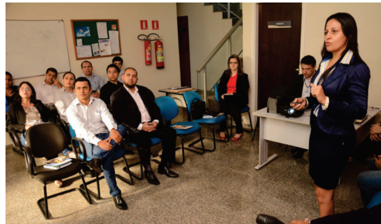
Palestrante e servidores durante Fórum

O evento teve por objetivo possibilitar aos participantes um locus de discussão e desenvolvimento de propostas de melhorias na utilização total do programa, remetendo o debate às ações necessárias para a implementação das