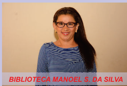
BIBLIOTECA MANGEL S. DA SILVA