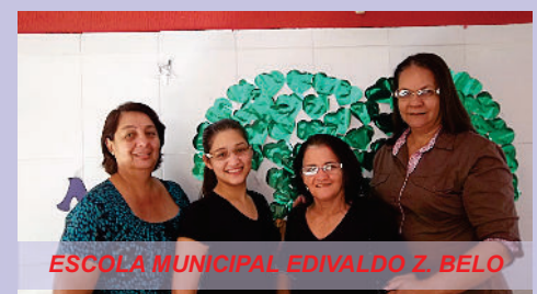
ESCOLA MUNICIPAL EDIVALDO Z. BELO