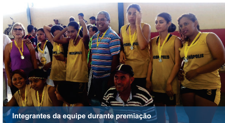
Integrantes da equipe durante premiação

Ainda segundo a educadora, a equipe não tem quadra para realizar os treinos e para competir na cidade as meninas tem que ficar o dia inteiro fora de casa pois não tem como voltar no meio da