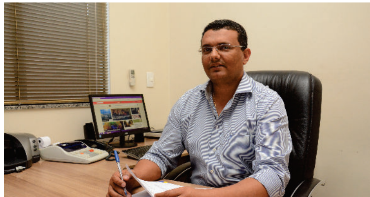
A aprovação das contas anuais evidencia a responsabilidade e o comprometimento dos gestores do IMPRO

Na Sessão Ordinária do Tribunal de Contas do dia 09 de Julho, as Contas Anuais de Gestão de 2013 do Instituto Municipal de Previdência Social dos Servidores de Rondonópolis (IMPRO) foram aprovadas sem ressalvas por unanimidade