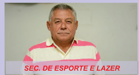
SEC. DE ESPORTE E LAZER